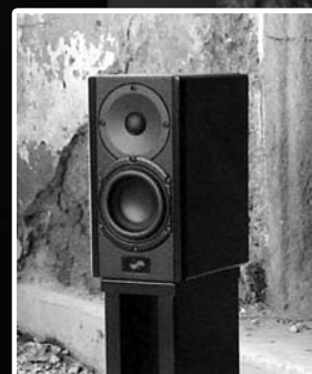
Adut 3.699 2.196 KN