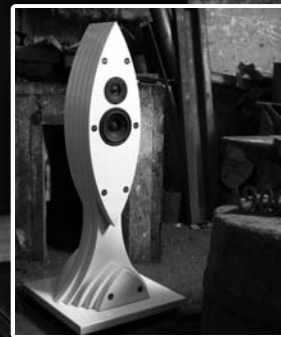
Abyss Massimo 48.999 35.000 KN