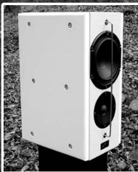
Jana Walk 4.500 3.050 KN