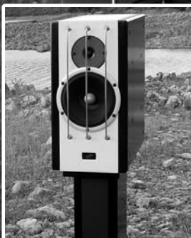
Peyote 2 12.999 8.999 KN