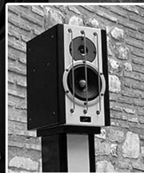
Pimienta 2 2.999 7.500 KN