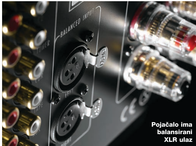
Pojačalo ima balansirani XLR ulaz